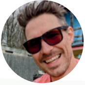
Martin Windsurfen & Wingfoilen